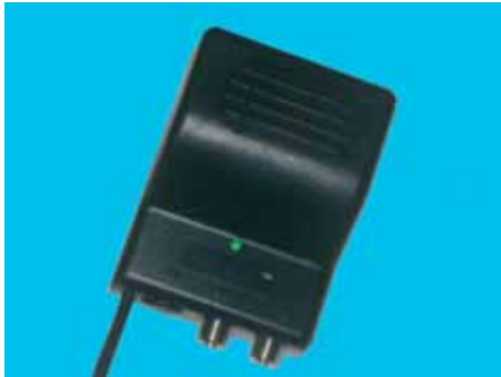
Articolo 7005F Item 7005F