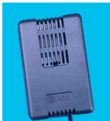
Articolo 7002 Item 7002