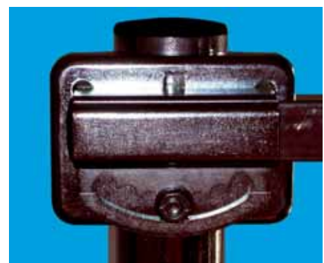
Attacco a palo Mast bracket